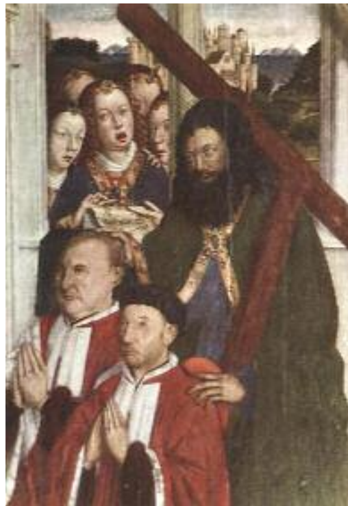
هانس بالډونگ Hans Baldung